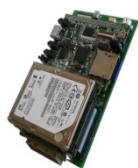
デジタルビデオレコーダ(DVR)