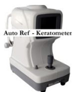
医療機器 / 角膜測定器