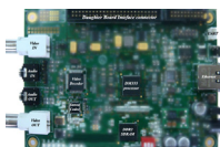
ビデオ監視システム