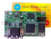
眼球検査機器 制御コントローラ